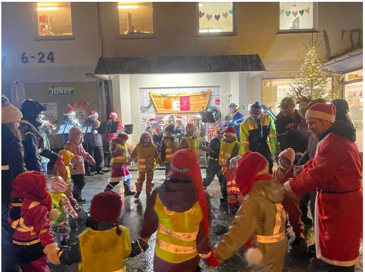
JULEMUSIKK: Kveikjing av lysa i gran på Stamnes. Blanke Messingen sytte fro julemusikk.